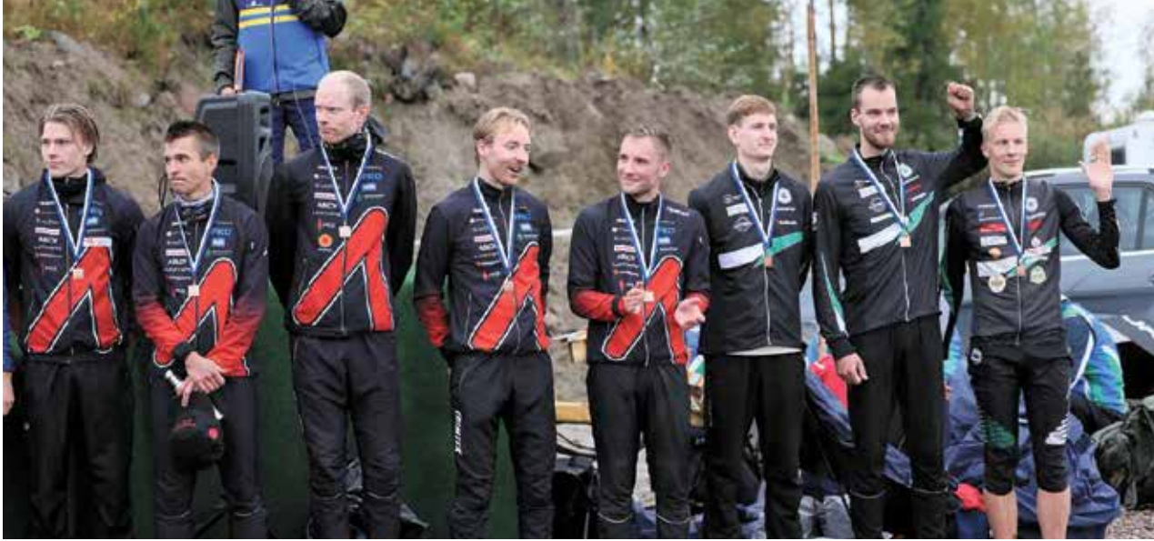
Kuva palkintojen jaosta. VeVen joukkueen vasemmalla puolella sijoille 8 ja 9 sijoittuneita Kalevan Rastin urheilijoita.