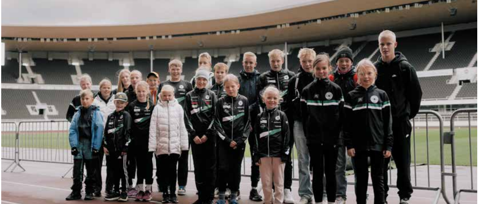
Hieno joukko VeVe:n urheilijoita tutustumassa Olympiastadionin kenttään.

@veehiihto @vevesuunnistus @veveyleisurheilu @jukolanviesti