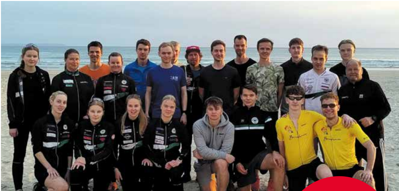
Edustusryhmä Barbatessa.

lat metsään. Tapahtuman aikana palautetta odotta- maan kävijöiltä: olipa pitkä- rata, hirveää pusikkoa, huo- nokulkuista maastoa, mäet isoja, rastit piilossa, emit- kapulat väärinpäin puus- sa ym. jopa Jannen teke- mää karttaa ehditään vauh- dissa arvostelemaan, mut- ta kaiken kaikkiaan iloisia suunnistajia tulee maaliin ja kohti seuraavaa tapah- tumaa. Ratamestari tote- aa taas kerran, että olipas mukavaa puuhaa ja muka- via ihmisiä. Ensi vuonna on Jukolan kunniaksi tarjolla Jukola koulu. ■