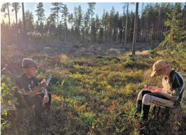
Harjoituksessa maastossa huilitauko samalla karttaa tutkien.