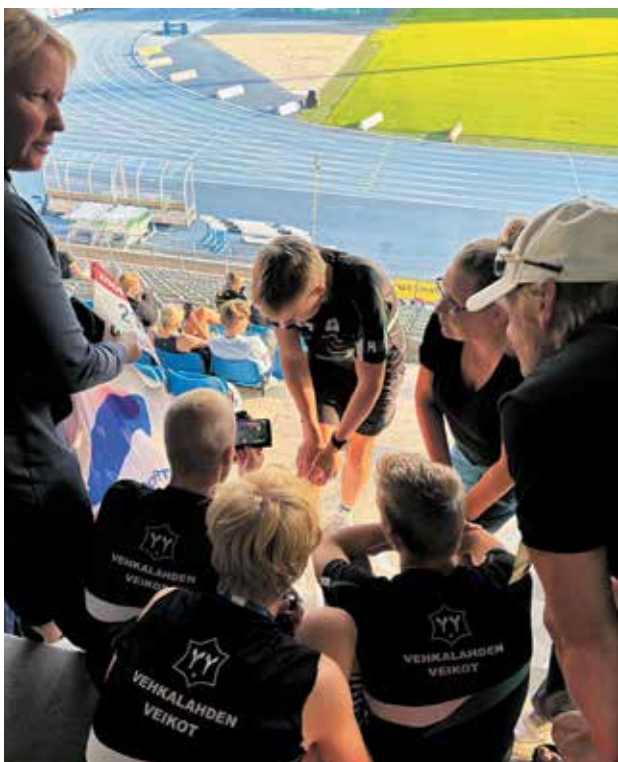
Huoltajat ja urheilijat analysoivat yhdessä viestijuoksun onnistumisia kilpailun jälkeen.

Vehkalahten Veikkojen menestys on osoitus pitkäjänteisestä ja intohimolla tehdystä seuratyöstä, niin kentällä kuin sen ulkopuolella. Kiitos kaikille valmentajille, huoltajille, talkoolaisille ja tukijoille – teidän panoksenne tekee tällaiset hetket mahdollisiksi. Tämä mitali kuuluu meille kaikille ja kertoo siitä, kuinka askel askeleelta rakentuu menestystä, yhdessä. ■