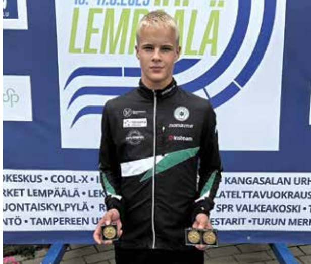
Miro Aatolasta Lempäälän triplamestar.